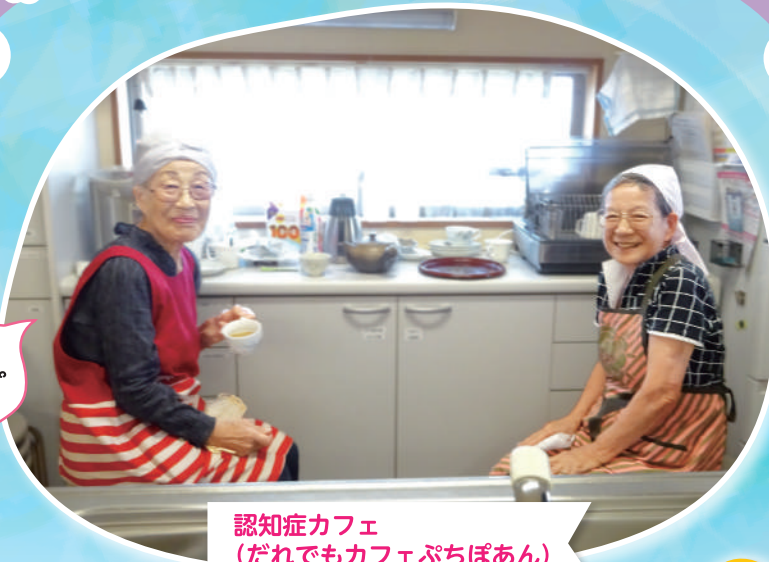
認知症カフェ (だれでもカフェぷちぼあん)