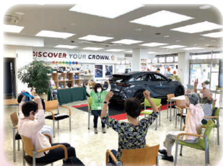
トヨタモビリティ東京調布国領店での10筋

最近では、トヨタモビリティ東京調布国領店にご協力をいただき、10筋の体験会を開催しています。