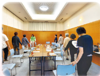
ひだまりサロンでの10筋