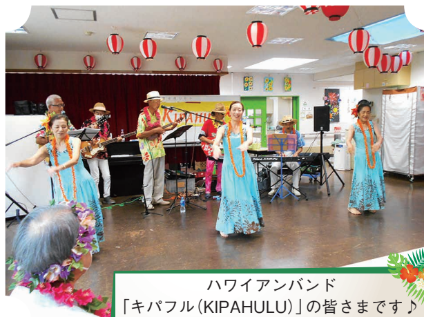
ハワイアンバンド 「キパフル(KIPAHULU)」の皆さまです♪