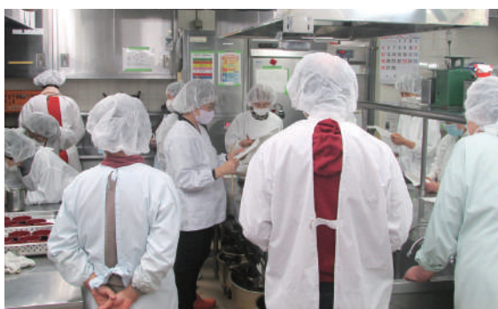
皆さま真剣に学ばれていました。