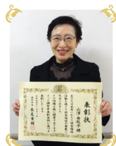
このたびは受賞おめでとうございます！