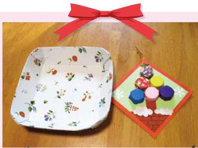
お皿 クリスマスカード

どちらもカラフルで、ご利用者さまも、「かわいらしい」と嬉しそうに、受け取ってくださいました。 材料をご寄附いただいた皆さまには、この場をお借りして御礼申し上げます。